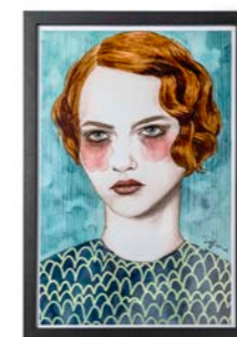
Poster | € 16,99 Poster 'Sasha' van Junique