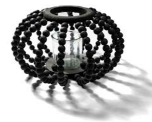
Kandelaar DOC living, Ridderkerk