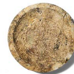
Ornament Noa May living, Barendrecht